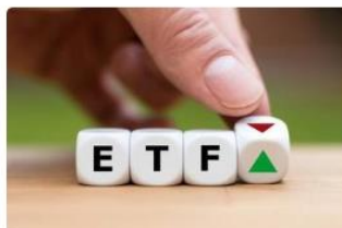
将来に備え、じっくり資産を増やしたい！長期投資に適した主要資産ETF