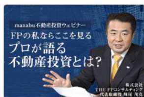
FPの私ならここを見る プロが語る不動産投資とは？