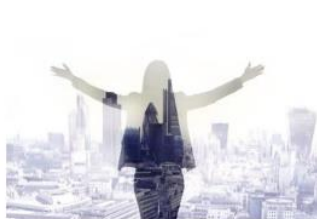
不動産投資の成功率を上げる8つの方法