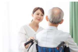
40歳で手取りが減る？介護保険料とは