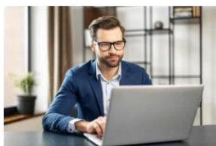
30代以降も成長できる人とは？70歳まで雇用される人材を目指して