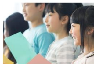
習い事漬けは無意味？成績が良い子どもを育てる親の共通点