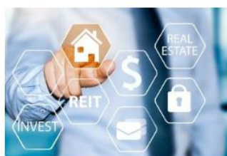
少額から始められる不動産投資4選