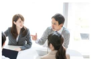
50代で後悔しないために！30代で必ずやるべきこと