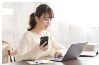
2024年の新NISAは現行NISAと何が違う？事前に確認を