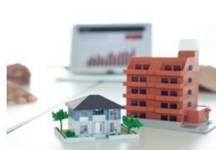
不動産投資の種類はいくつある？ 代表的な投資方法を紹介